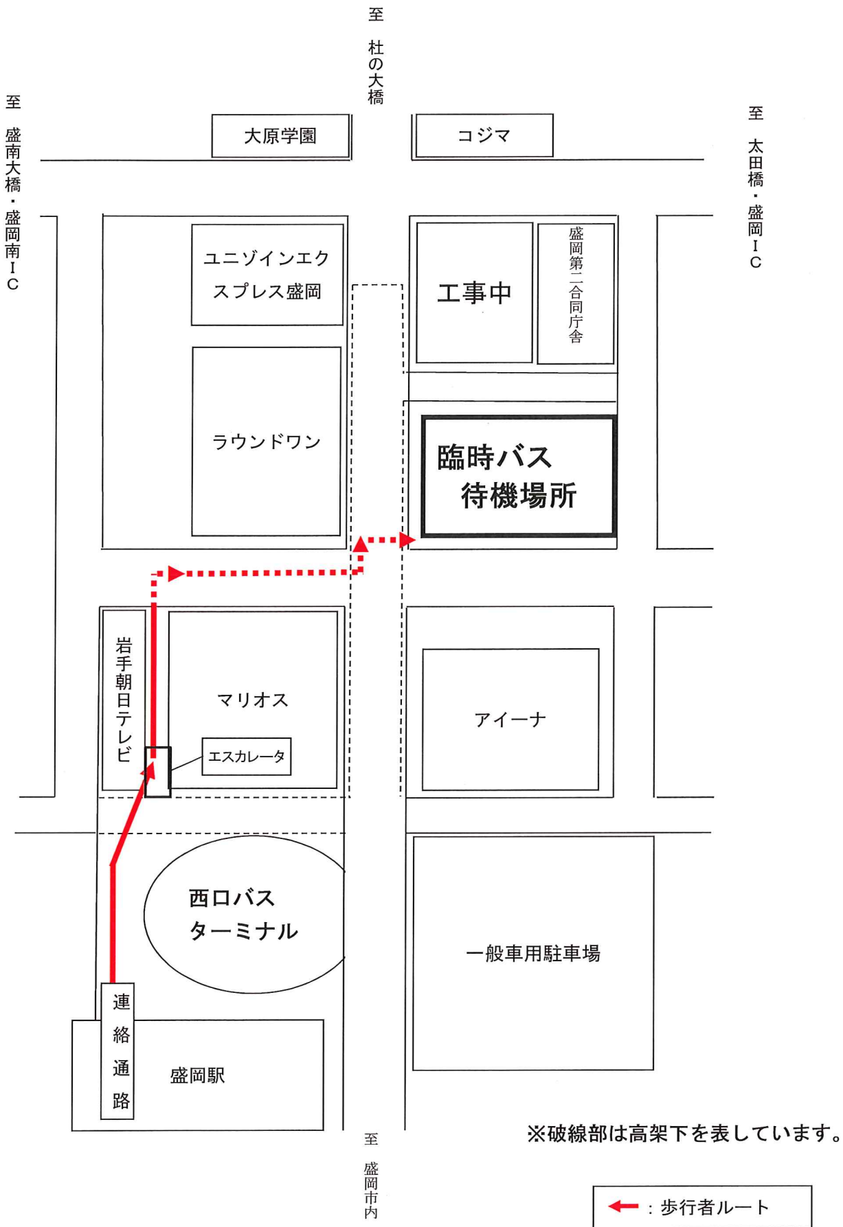
臨時バス待機所 歩行者案内図